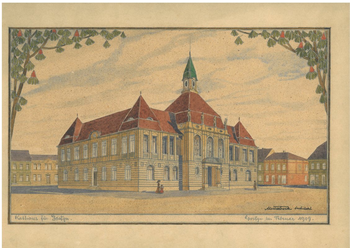
Projekt gostyńskiego ratusza wykonany przez Lucjana Michałowskiego