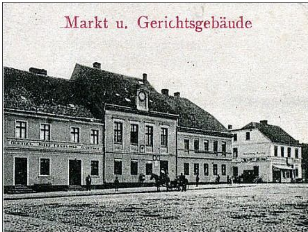
Rynek na przełomie XIX i XX wieku