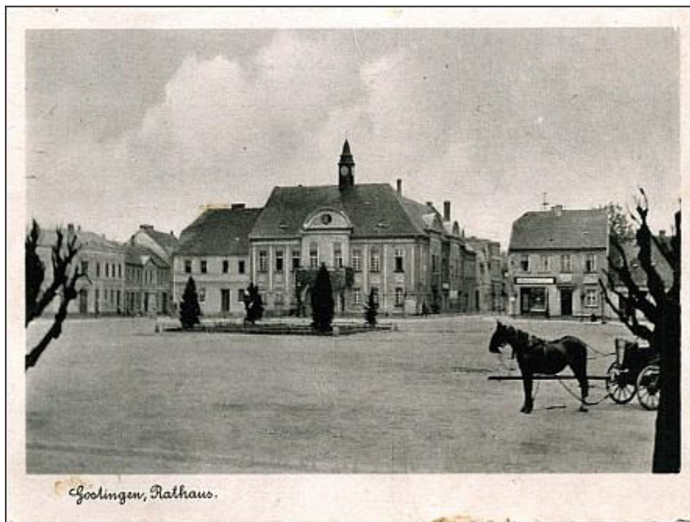
W latach wojny 1939-1945