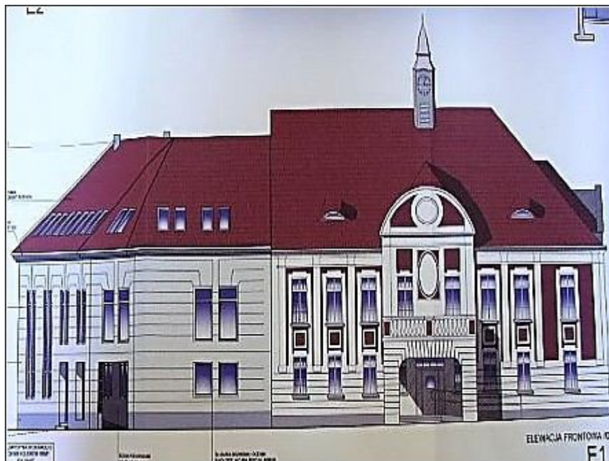
Projekt rozbudowy ratusza