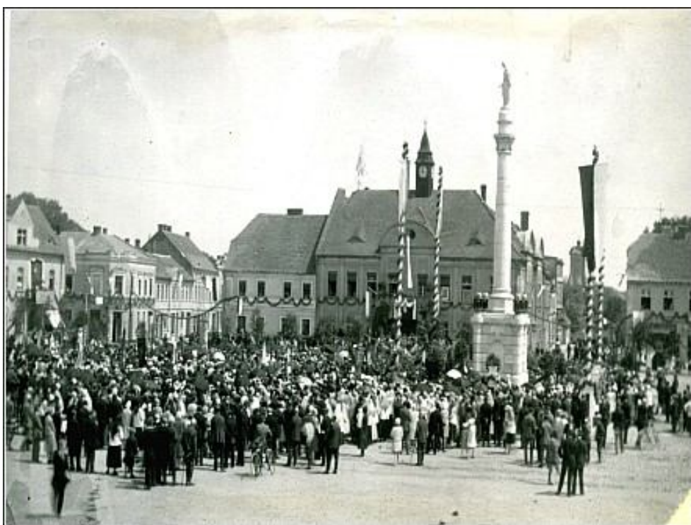
Uroczystość poświęcenia Pomnika Serca Jezusowego 21 lipca 1929 roku