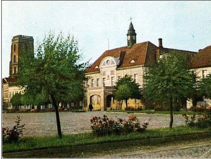
Lata 70. XX wieku