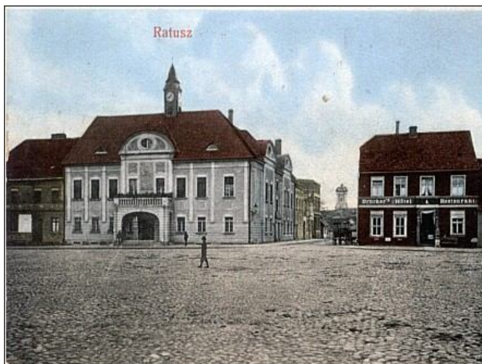
Wschodnia część Rynku w 1913 roku