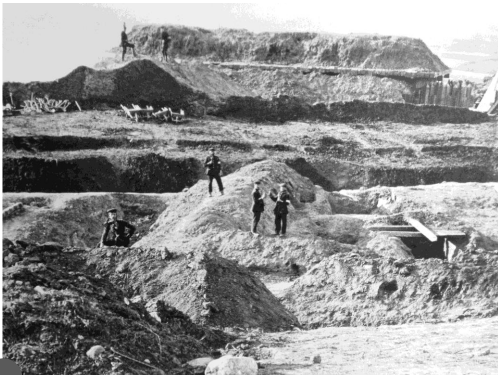
Pruscy żołnierze na zdobytym szańcu, Dybbøl (1864)

na polu bitwy zmalało i ograniczyło się do określonych ról. W wypadku tej wojny należy odnotować również duży udział jednostek Landwehry w działaniach wojennych. To także obrazuje skalę konfliktu. W tej formacji udało się odnaleźć 16 żołnierzy. Bardzo wiele osób zostało odznaczonych za postawę na polach bitewnych (głównie Krzyżami Żelaznymi II klasy) – takich żołnierzy było 14.