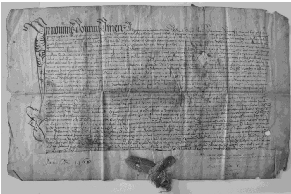
Dokument z 1468 roku: Erygowanie ołtarza Nawiedzenia Maryi Dziewicy, św. Mateusza Apostoła i św. Marii Egipcjanki, (APP, Dokumenty i akta kościołów, sygn. D 81: 1468 In Nomine Domini Amen)

Każda konfraternia religijna działała według określonych zasad i wewnętrznej struktury organizacyjnej. Powoływała urzędników, którzy kierowali jej działalnością i wykonywali rozmaite posługi w codziennej pracy. Funkcje kierownicze sprawowali: promotor (był nim duchowny parafialny, najczęściej proboszcz), protektorzy (urząd honorowy), seniorzy, konsyliarze (doradcy zarządu), podskarbiowie (czyli skarbnicy) oraz sekretarze (pisarze, do zadań których należało m.in. prowadzenie ksiąg brackich). Natomiast czynności związane z praktyczną działalnością bractwa wykonywali: jałmużnicy (zbierali jałmużnę w samym kościele parafialnym, przy kościele, w mieście lub na cmentarzu parafialnym), marszałkowie, chorążowie (do noszenia chorągwi podczas procesji), zakrystianie, wizytatorzy chorych lub serwitoremie, kantorowie i kantorki (prowadzący śpiew) oraz panny do feretronów (do noszenia obrazów brackich podczas procesji) 13 .