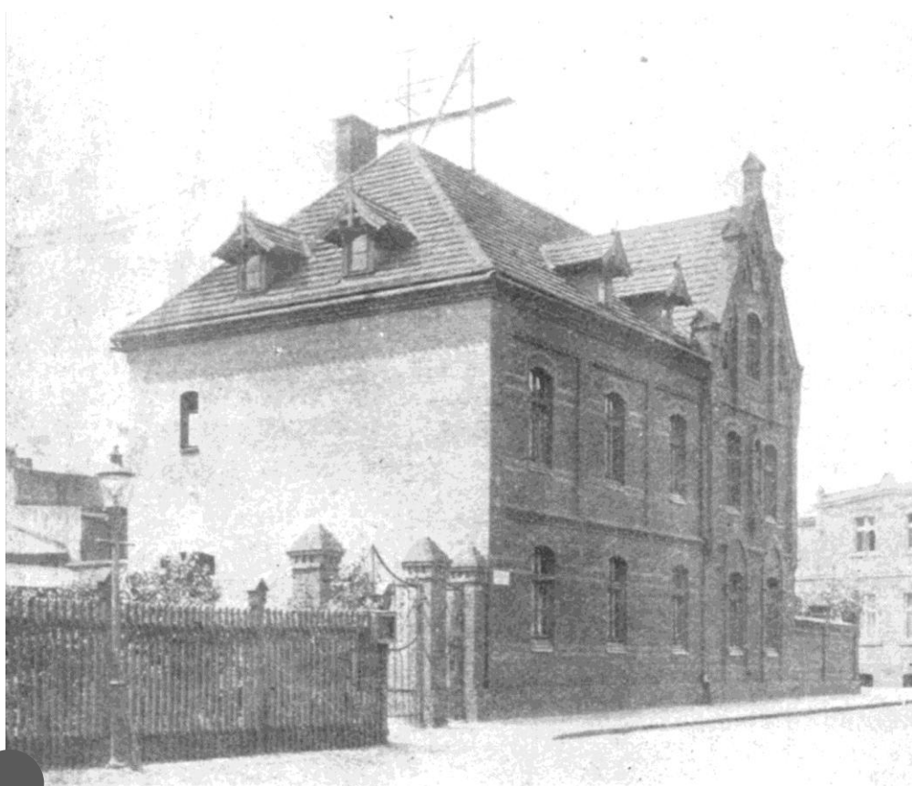
Szpital św. Ducha przy ulicy Kościelnej

W 1936 roku działająca tu instytucja kościelna zmieniła nazwę na Zakład Kościelny Schronisko dla Starców pw. św. Ducha. Od tej chwili postanowiono zatrudniać dwóch etatowych pracowników: pielęgniarkę (jednocześnie kierowniczkę placówki) i kucharkę. Schronienie w nim mogło uzyskać 16 osób. Na jednego pensjonariusza przypadało 10 m 2 powierzchni. Pensjonariuszami mogli zostać ubodzy katolicy niezdolni do pracy i nieposiadający rodziny. Schronisko zapewniało im bezpłatny pobyt, wyżywienie i opiekę medyczną. W miarę możliwości urządzano odczyty, spotkania, czytanie książek i czasopism. Surowo zakazane były zaś kłótnie, żebractwo i pijaństwo. Nakłaniano do uczestnictwa w życiu religijnym parafii.