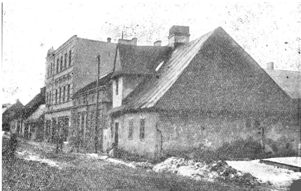
Szpital św. Ducha przy ulicy Leszczyńskiej (rozebrany w 1904 roku)

Jak wynika z akt wizytacyjnych biskupów poznańskich, był to raczej przytułek dla niepełnosprawnych i starców. Nie można jednak wykluczyć, że podopiecznych również leczono. Z kronik klasztoru benedyktynów w Lubiniu wiemy bowiem, że zajmujący się leczeniem mieszkali poza opactwem, także w Krzywiniu i Gostyniu.