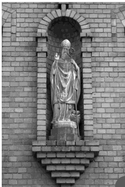
Rzeźba św. Mikołaja na elewacji budynku przy ulicy Kościelnej 5

Na fasadzie budynku, między oknami pierwszego piętra, ustawiono figurę św. Mikołaja (żył na przełomie III i IV wieku, był biskupem Miry w Licji, wstawił się cudami oraz pomocą biednym i potrzebującym). Przez wieki był jednym z najbardziej czczonych świętych na Zachodzie i Wschodzie – między innymi był patronem sierot, biednych, a także ubogich panien na wydaniu. Dziś uważany jest także za opiekuna dzieci, marynarzy, żeglarzy, rybaków, flisaków, młynarzy, piekarzy, cukierników, bednarzy, gorzelników i piwowarów, mieszczan, kupców, uczonych i studentów, notariuszy, obrońców wiary przed herezją, pielgrzymów i podróżnych, rolników, wytwórców guzików, kancelistów parafialnych, sprzedawców perfum, wina, zboża i nasion, sędziów, więźniów i jeńców. To chyba najbardziej „zapracowany” święty. Popularność kultu spowodowała, że poświęcono mu tysiące kościołów, ołtarzy, kaplic, szpitali i hospicjów.