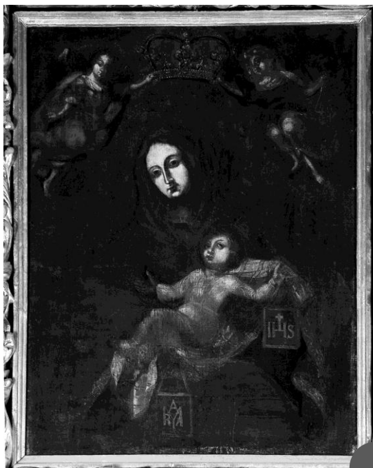
Obraz Matki Bożej Szkaplerznej w ołtarzu głównym kościoła pod wezwaniem św. Małgorzaty w Gostyniu