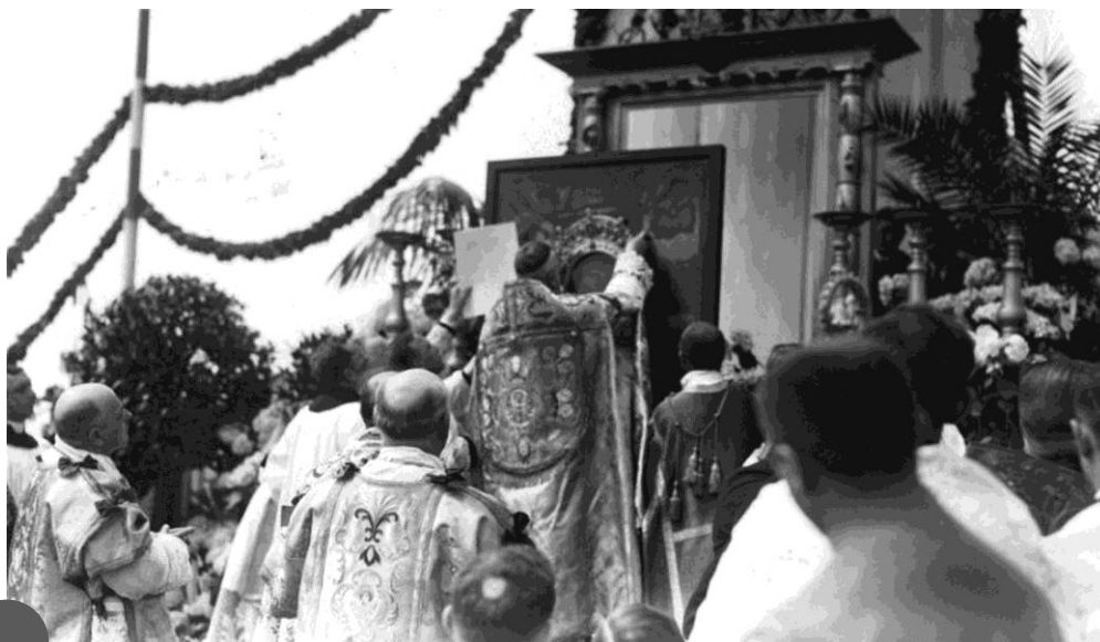
Prymas Polski kardynał August Hlond nakłada korony papieskie Piusa XI

W numerze 50. periodyku zamieszczono obszerną relację z przebiegu dwudniowych uroczystości. Z niej dowiadujemy się, iż gośćmi honorowymi byli prymas kardynał August Hlond i nuncjusz apostolski arcybiskup Francesco Marmaggi. Przybyli oni do granic powiatu gostyńskiego samochodem.