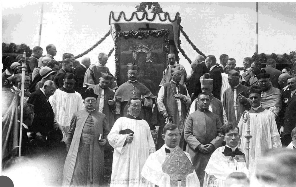
Uroczysta procesja przenosząca obraz Świętogórskiej Róży Duchownej z kościoła na oltarz koronacyjny