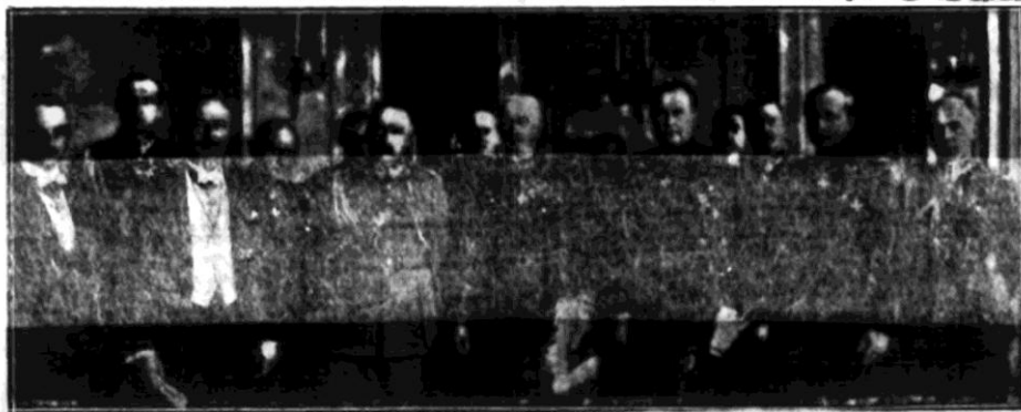
Wielki Krzyż Zakonu Kawalerów Maltańskich na piersiach Marszałka Piłsudskiego