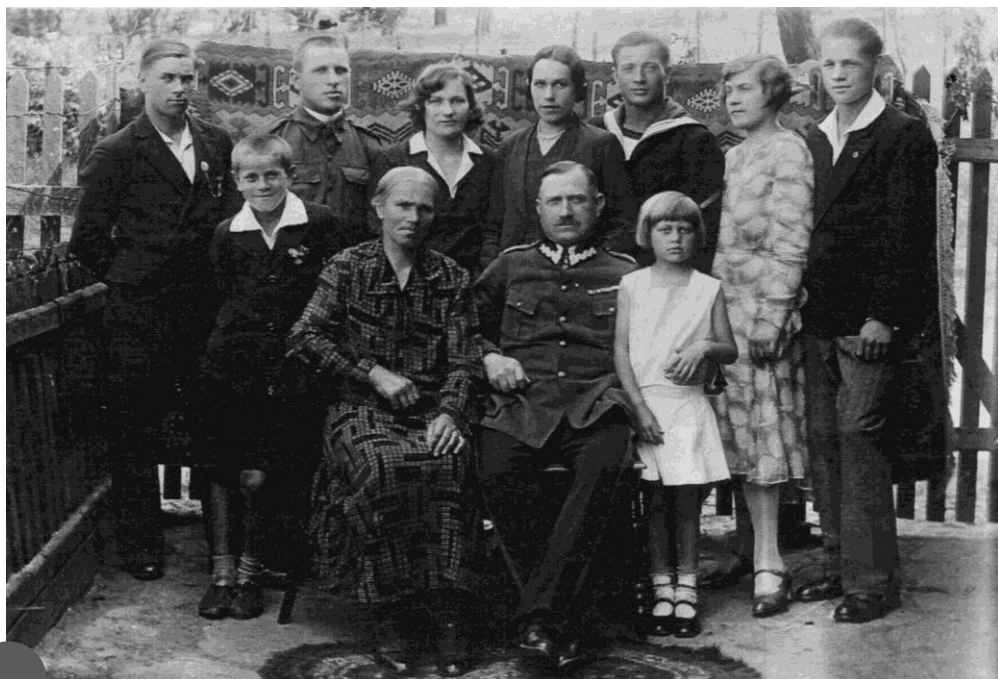
Rodzina Sobeckich - wszystkie żyjące wówczas dzieci. Toruń, 24 maja 1931 roku.

Do Związku Powstańców Wielkopolskich składał akces w marcu 1939 roku 98 . Proces weryfikacji trwał kilka miesięcy i zakończył się tuż przed rozpoczęciem wojny. Legitymacja członkowska z numerem 20168 wystawiona została w Poznaniu 24 sierpnia 1939 roku. Prawdopodobnie nigdy jej nie odebrał, gdyż nie została podpisana. Wymowne pozostają niewypełnione w legitymacji rubryki składkowe za lata 1939-1947, czyli lata ważności legitymacji a jednocześnie lata, w których nie mógł się cieszyć efektami swojej działalności powstańczej i niepodległościowej.