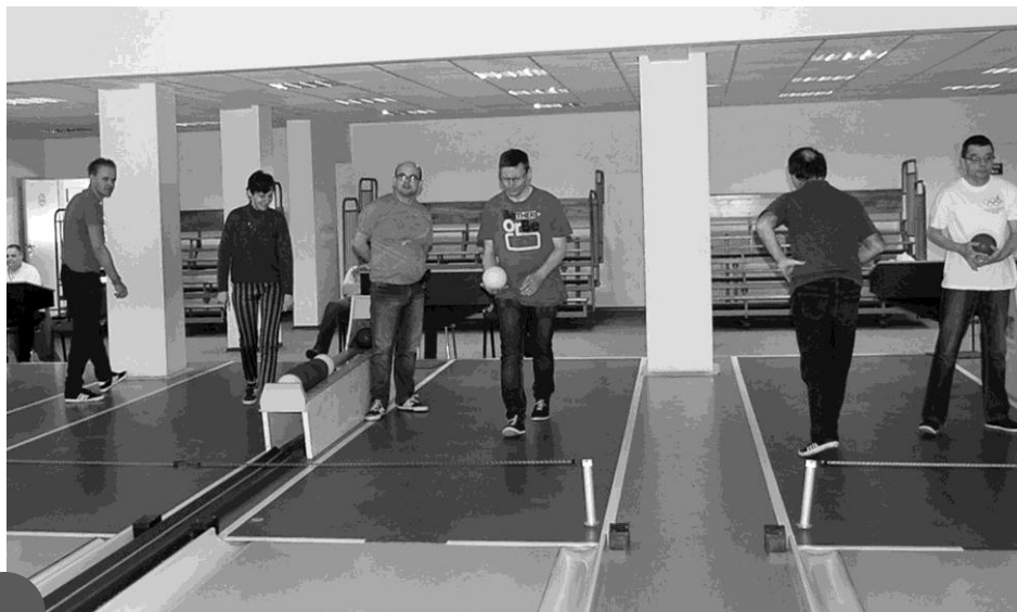
Zajęcia z uczestnikami ŚDS na gostyńskiej kregielni

Dom działa pięć dni w tygodniu, przez osiem godzin dziennie. Co najmniej sześć godzin dziennie prowadzone są zajęcia z uczestnikami. ŚDS umożliwia uczestnikom skierowanym na pobyt dzienny spożywanie gorącego posiłku przyznanego w ramach zadania własnego gminy, w ramach treningu kulinarnego lub umożliwia zakup gorącego posiłku. Obecnie Środowiskowy Dom Samopomocy w Gostyniu jest placówką pobytu dziennego, ośrodkiem wsparcia dla 31 osób, prowadzi działalność typu A (dla osób przewlekle psychicznie chorych) i typu B (dla osób z niepełnosprawnością intelektualną). Dom świadczy usługi dla osób z terenu miasta i gminy Gostyń, a w uzasadnionych przypadkach dla potrzebujących tej formy pomocy z gmin ościennych powiatu gostyńskiego. Z odległych części miasta i spoza miasta zapewnia się uczestnikom transport na zajęcia oraz powrót do domu.