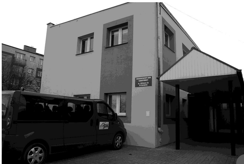
Siedziba Środowiskowego Domu Samopomocy w Gostyniu (2018)

W ciągu ostatnich lat ŚDS poszerzał ofertę usługową dla mieszkańców potrzebujących wsparcia poprzez zwiększenie zakresu zajęć, dostosowanie obiektu do wymaganych standardów, rozszerzenie zakresu terapii i dostosowanie pracowni terapeutycznych do potrzeb uczestników i specyfiki prowadzonych treningów. W ramach tych działań wykonano sukcesywnie wiele remontów. Zamontowano również bramę roletową zabezpieczającą dojście do platformy do transportu osób. Wbudowano szafki we wnęce korytarza służące jako część szatni dla uczestników. Doposażono w sprzęt rehabilitacyjny salę rehabilitacji ruchowej oraz pracownię kulinarną.