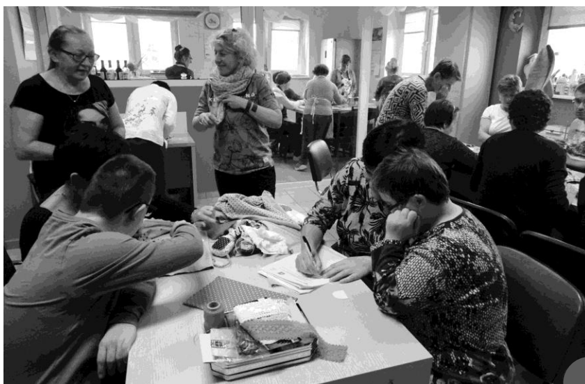
Zajęcia w siedzibie ŚDS w Gostyniu

lub zespołowych treningów samoobsługi i treningów umiejętności społecznych polegających na nauce, rozwijaniu lub podtrzymywaniu umiejętności w zakresie czynności dnia codziennego i funkcjonowania w życiu społecznym. Prowadzone są zajęcia z zakresu: treningu funkcjonowania w życiu codziennym – umiejętności praktycznych, samoobsługowych i zaradności życiowej, treningu umiejętności spędzania czasu wolnego, treningu umiejętności interpersonalnych, społecznych i rozwiązywania problemów, w tym kształtowanie pozytywnych relacji uczestnika z osobami bliskimi, innymi osobami, w instytucjach kultury, treningu aktywizacji zawodowej – zwiększenie kompetencji interpersonalnych i społecznych niezbędnych w poszukiwaniu pracy, edukacji.