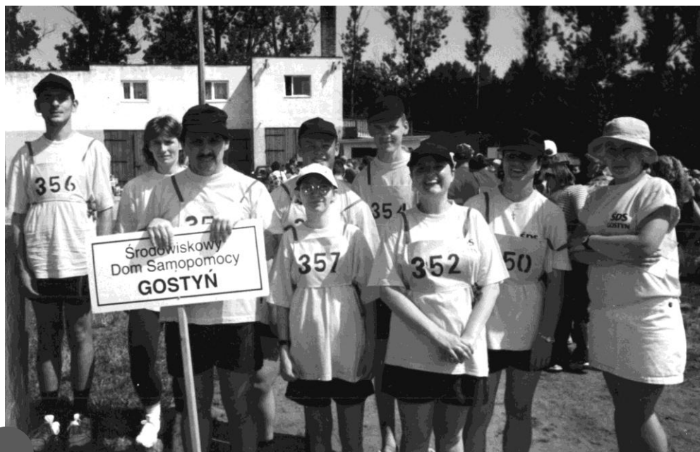
Reprezentacja ŚDS podczas zawodów sportowych na stadionie w Gostyniu

Uczestnicy terapii znajdują w ŚDS odpowiednie miejsce dla zaspokojenia swoich potrzeb, rozwijania własnych umiejętności społecznych i praktycznych, zainteresowań i samorealizacji. Poprzez udział w zajęciach mają możliwość poszerzenia zamkniętego kręgu znajomych, (ograniczającego się zazwyczaj do rodziny), poznania nowych ciekawych ludzi. Przede wszystkim ludzi z pasją, co wpływa również na rozwój zainteresowań uczestników. Dom stwarza nowe możliwości tym osobom i ich rodzinom. W ciągu roku można zaobserwować ogólny wzrost poziomu wiedzy i motywacji uczestników.