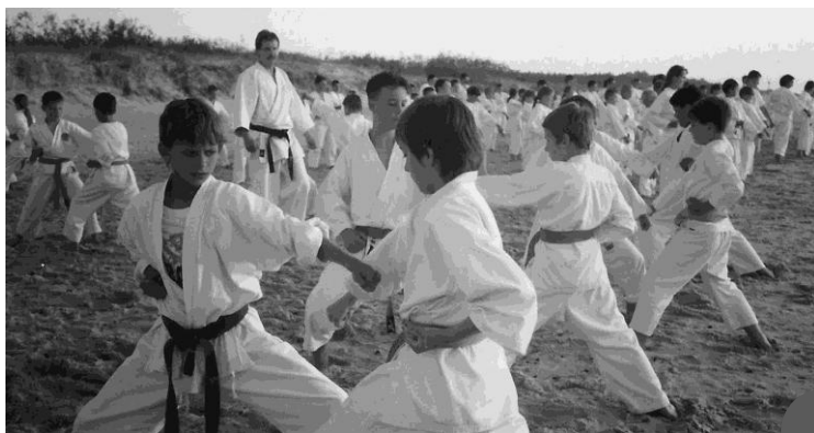
Zajęcia na plaży podczas obozu treningowego w Ustce (1995)

Rozwój człowieka jest w tej sztuce wspinaniem się po niekończących schodach, wytrwałym wspinaniem, a nie przeskakiwaniem ich. Uczeń, którego ciało i umysł zaczną współdziałać, zaczyna się nieustannie rozwijać niezależnie od wieku. (...) Aż do dnia śmierci proces się nie kończy, bo choć nikt nie może być idealny, to możemy się przecież starać być coraz lepsi 8 .