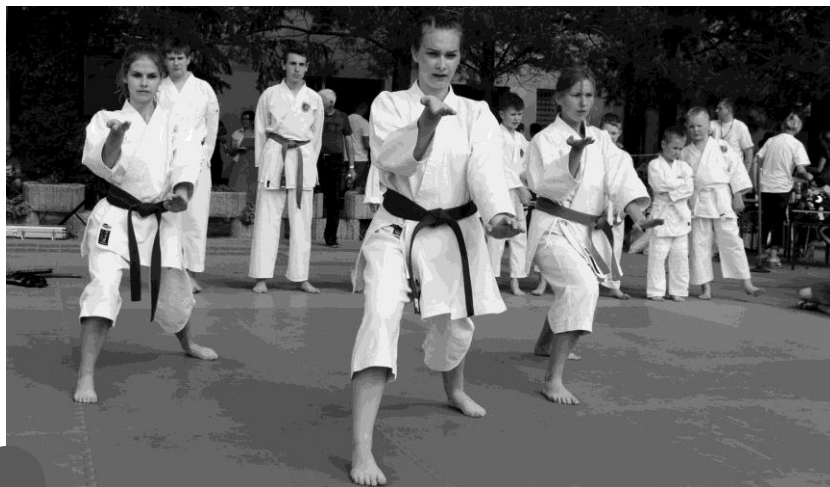
Pokaz karate na imprezie charytatywnej w Szkole Podstawowej nr 5 w Gostyniu (2019)