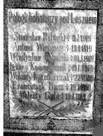
Grobowiec i płyta nagrobna w Strzelcach Wielkich.